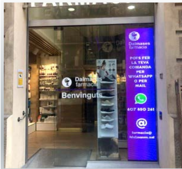
Farmacia Dalmases (Barcelona) Led alto brillo p4