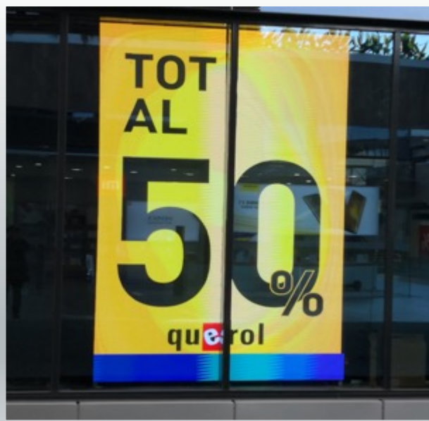
Zapateria Querol (Esplugues de Llobregat) Led alto brillo p4