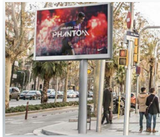
Projecto Palafolls Led exterior bajo consumo p6