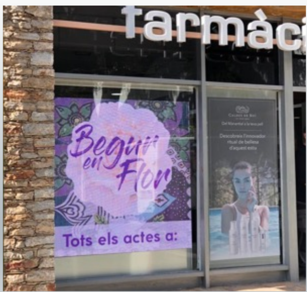
Farmacia Sonia Torres (Begur) Led alto brillo p4