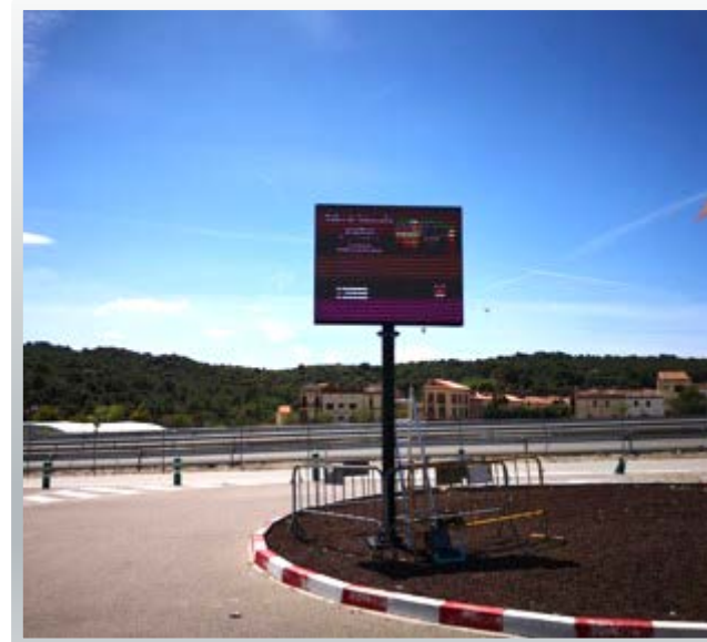
Ayuntamiento de Collbató Monoposte led exterior p6